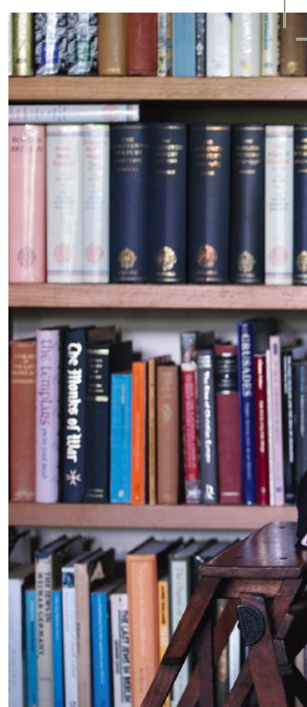
Fay er født i England, men voksede op i New Zealand, indtil hun som 14-årig vendte hjem til England sammen med sin mor efter forældrenes skilsmisse.

Fay Weldon mener, at man som forfatter kun kan skrive ordentligt i gennemsnitligt fem timer dagligt, hvilket efterlader 19 timer i døgnnet, der skal fyldes